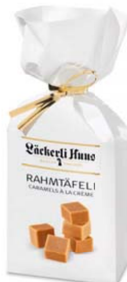
Lächerli Huus, Rahmtäfel, 200 g (100 g = 3.20)