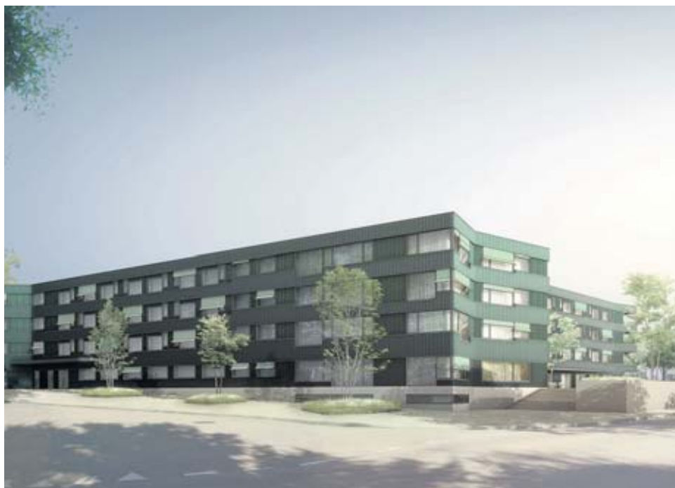
Das neue Alterspflegeheim setzt auf jeden Fall einen neuen Impuls in Riehen, dem «grossen grünen Dorf».