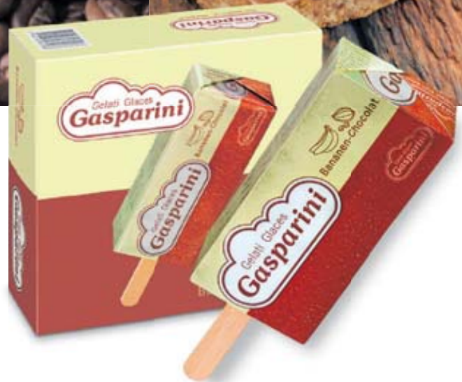
Gasparini Bananen-Chocolat-Glace, 6 × 80 ml (100 ml = 2.07)