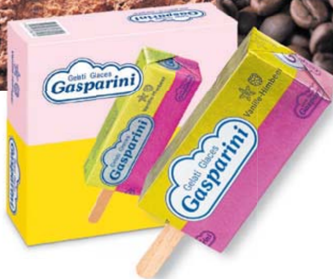
Gasparini Vanille-Himbeer-Glace, 6 × 80 ml (100 ml = 2.07)