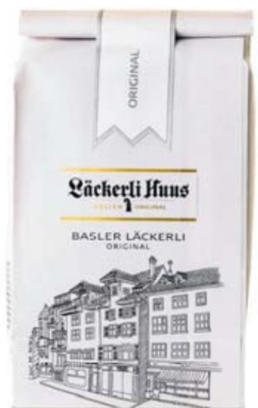
Lächerli Huus, Basler Lächerli, 300 g (100 g = 2.50)