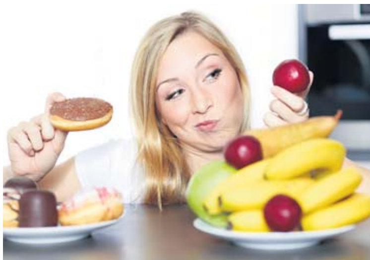
Obst oder Kohlenhydrate?